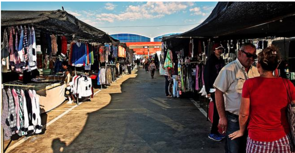
Monday market la Carlota . Córdoba. Do you find me?

1. Por grupos, comentad en voz alta estas cuestiones antes de empezar con la unidad: ¿te gusta ir al mercado? ¿Qué productos puedes encontrar? ¿Qué tipo de compras sueles realizar allí? Si has ido alguna vez a un mercado español, ¿qué diferencias encuentras con los mercados de tu país?